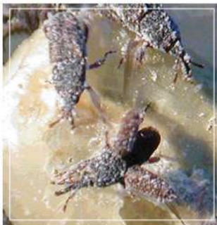
Gorgojos del maíz

TU DENUNCIA CONTRIBUYE A LA REDUCCIÓN DE PÉRDIDAS DURANTE EL ALMACENAMIENTO DE GRANOS Y SEMILLAS